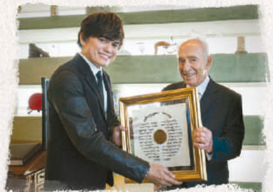
ENTGEGENNAHME EINER AUSZEICHNUNG FÜR INTERNATIONALE BEZIEHUNGEN VON MR. SCHIMON PERES

Wie sehr wünschte ich, ich könnte jede Person in meiner Kirche und jeden, der meinen Dienst verfolgt, persönlich auf eine geführte Tour durch Israel mitnehmen. Allerdings weiß ich auch, dass das praktisch und logistisch leider nicht möglich ist. Deshalb habe ich dieses Hilfsmittel geschaffen, um die Beschränkungen von Zeit und Raum zu umgehen und alle,