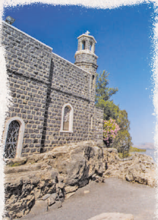
PRIMATSKAPELLE IN TABGHA

dass du allein schon beim Nachsinnen über die Wahrheiten in diesem Buch einen Heilungsdurchbruch erlebst. Denn unser Herr kann dich genau dort heilen, wo du heute gerade bist.