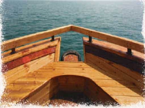
BOOTSFAHRT AUF DEM SEE GENEZARETH

Manchmal mag es sich so anfühlen , als sei es dem Herrn egal, was du gerade durchmachst. Aber du sollst wissen, dass er dich über alles liebt und inmitten deines Sturms ganz nah bei dir ist. Du brauchst dich nicht zu fürchten, ganz gleich, wie heftig die Wellen auch toben mögen. Du musst keine großartig klingenden Gebete sprechen oder die richtigen Worte finden, damit er antwortet. Allein schon dein Schrei berührt deinen Retter und bewegt ihn dazu, sich mit seiner Macht für dich einzusetzen.