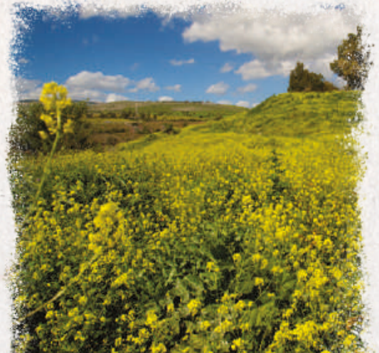
BLUMEN AUF DEM BERG DER SELIGPREISUNGEN

Mir ist es wichtig, dass du auf dieser Reise, die wir gemeinsam unternehmen, nicht