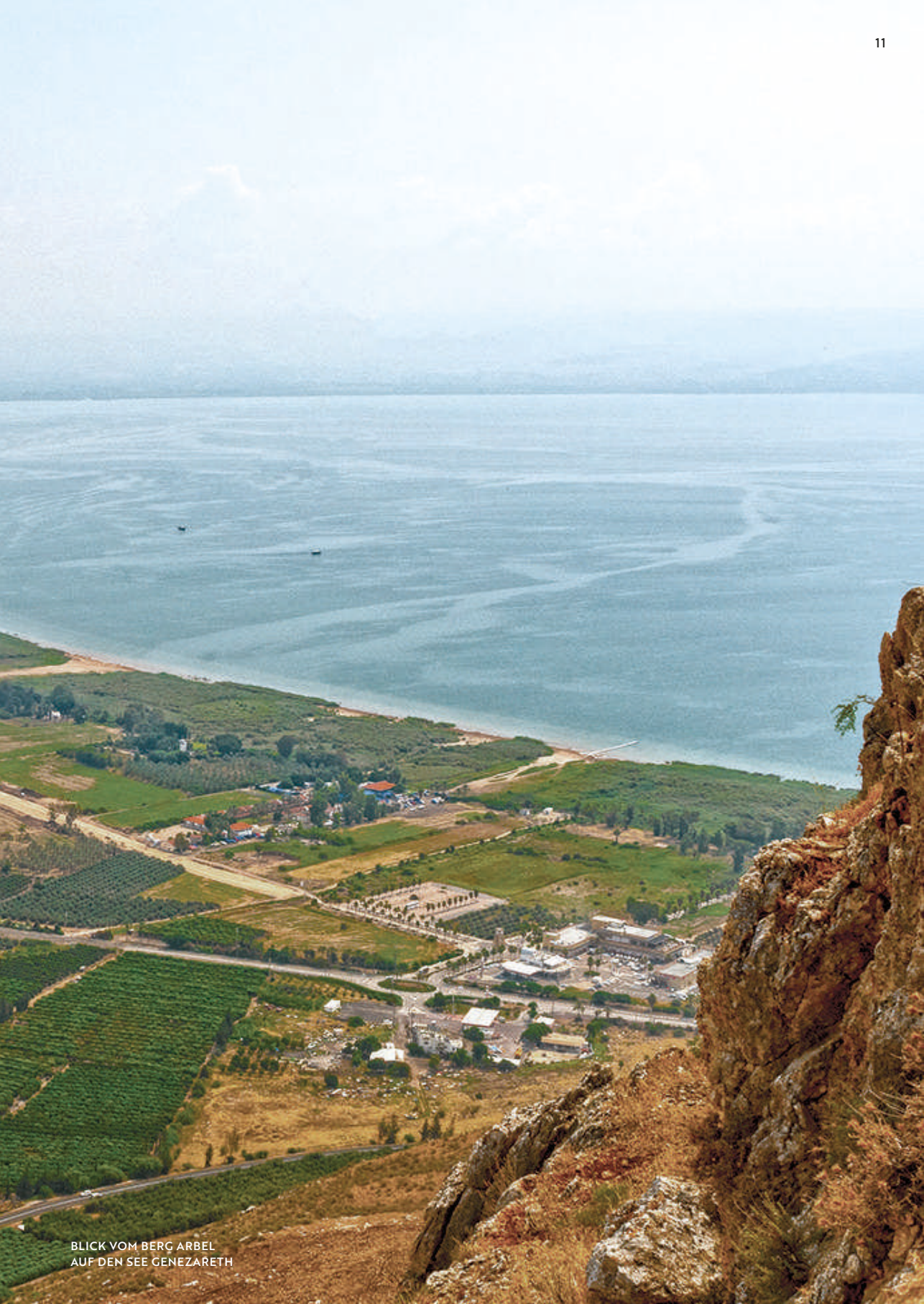
BLICK VOM BERG ARBEL AUF DEN SEE GENEZARETH